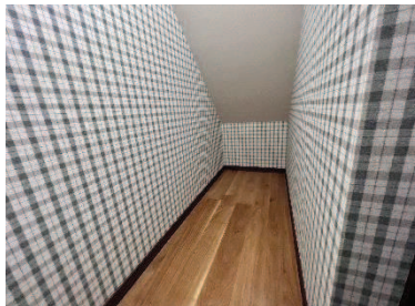
階段下を収納にして有効活用