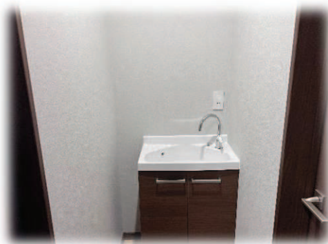
2Fにシンプルな洗面台を設置 何かと便利です。