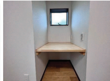
コンセントもあるので パソコンを置いてテレワークも