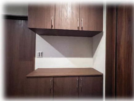
下駄箱は吊戸棚にして 空間があるので広く見えます