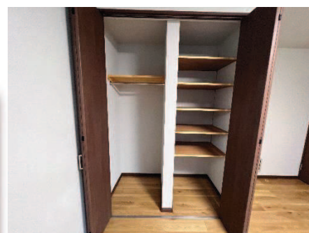
収納するものに合わせて 棚の高さを調整