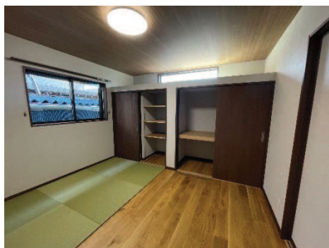
使わない時は サッとしまえる置き畳