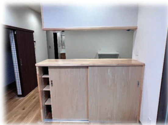
収納たっぷり キッチンの造作カウンター