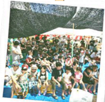
こんなにたくさんの方が集まりました！