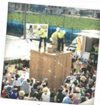
お楽しみのお菓子まき