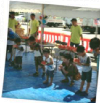
スイカ早食い競争